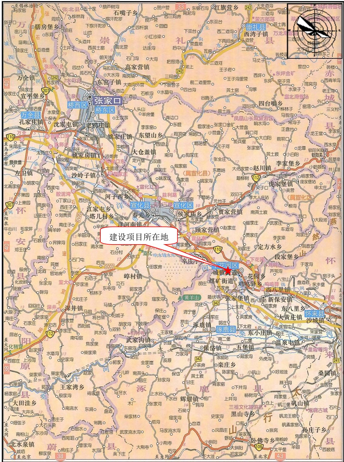
附图 1 项目地理位置图